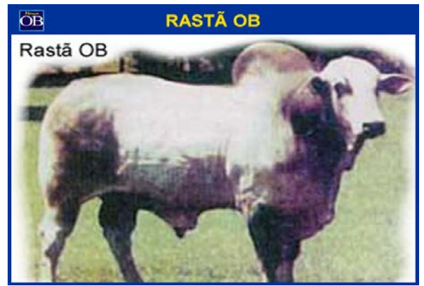
Animais produzindo Genética. Genética produzindo Animais.