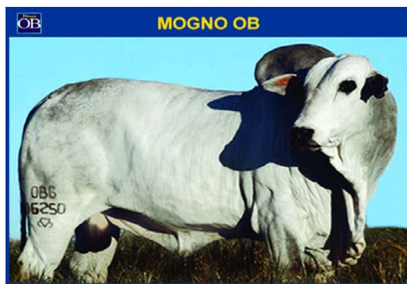
Animais produzindo Genética. Genética produzindo Animais.